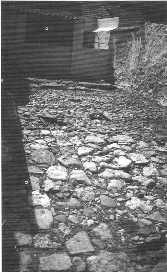
El arrecife construido por orden de 'Abd al-Rahman III entre Dar al-Na'ura y Madinat al-Zahrat.

Qarabita(Escarabita) 27 el año 29 (940-941) por la orilla inferior donde estaba la ciudad de Córdoba, para quitar al camino su dificultad. Cabalgó personalmente, mientras se hacían ante él las operaciones de agrimensura y se ponían los jalones de los límites, ordenando congregarse obreros y presurar la obra, que quedó concluida en un mes, con gran provecho de la nueva residencia llamada al-Zahra' y de todos". 28