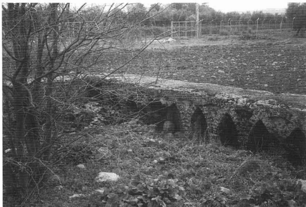
Restos de alberca árabe.