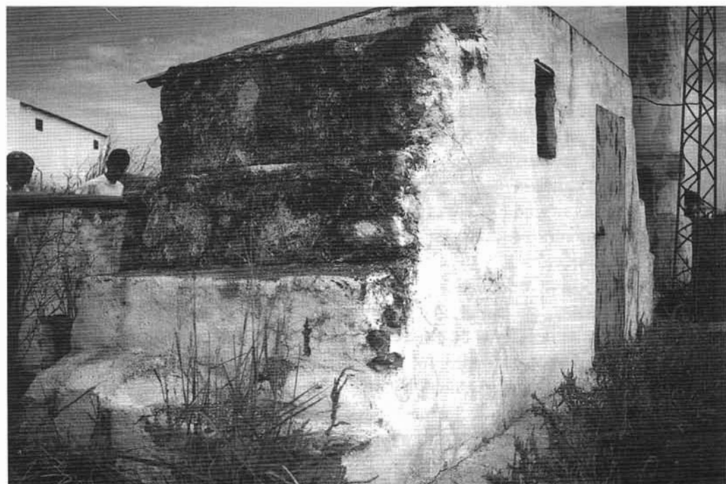
Caseta de la noria.