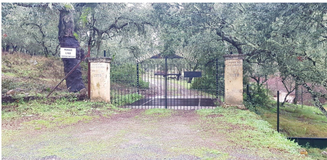
Imagen 2: Otra cancela cortando el Cordel de Las Palmillas

Efectivamente, el régimen casi exclusivamente privado, la estructura de la propiedad, la elevada alcurnia de los propietarios/as , junto a una administración ambiental achantada y subyugada permanentemente a los intereses de éstos, son elementos esenciales para analizar y entender la situación actual del Parque Natural Sierra de Hornachuelos desde el punto de vista del uso recreativo, deportivo y de ocio.