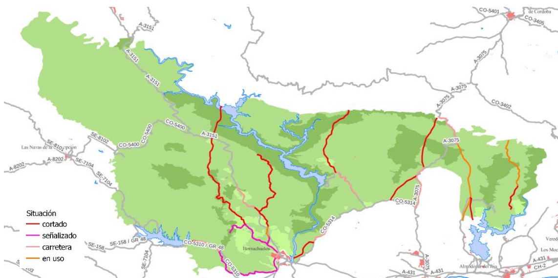
Mapa 2: Vías pecuarias del Parque Natural Sierra de Hornachuelos

Nada de esto se ha hecho, permitiendo la Junta de Andalucía que la mayor parte de la longitud de las vías pecuarias del Parque Natural sigan usurpadas, haciendo dejación de sus obligaciones, siendo cómplice de la usurpación y llevando al retraso en el desarrollo turístico del Parque Natural y a que sea el último de Andalucía en dotación de senderos.