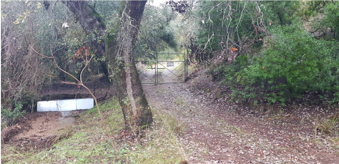
Imagen 1: Cancela que corta el Cordel de Las Palmillas

Entre esos tramos de vías pecuarias cortados están algunos que fueron deslindados hace más de 10 años, con la enorme inversión que ello supuso, y que sin embargo ha sido inútil. Ya en estos deslindes se señalaba que el objetivo era incluir esos tramos en la red de senderos, siendo una ampliación natural de la red actual, llevando a sitios emblemáticos como San Calixto. Sin embargo, nada de eso se ha hecho, ni un km de vías pecuarias de las deslindadas se ha incorporado a la red de senderos.