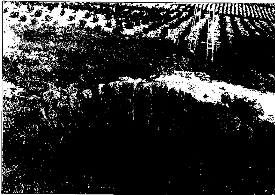
Puente sobre el Arroyo de Fontalba (Vereda de Granada).