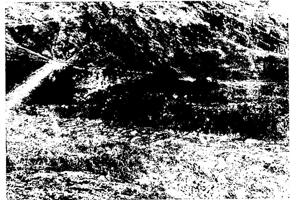
Vereda de Granada. Ramal de Sosontigui (Alcaudete, Jaén).