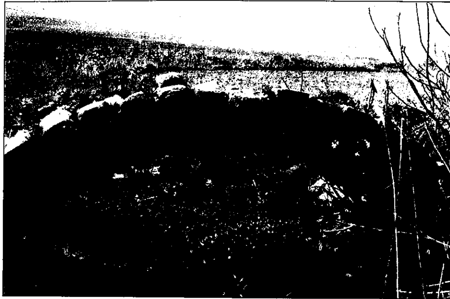
Puente sobre el Arroyo de de Trinidad (Vereda de Granada).